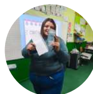
3° lugar 7 Básico A