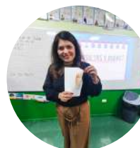
2° lugar 8 Básico B