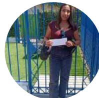
1° lugar 1 Básico A

Finalmente, una apoderada planteó una observación sobre la limpieza de los baños, tema que fue abordado junto a la encargada del área, quien entregó las respuestas y medidas correspondientes para dar solución a la situación.