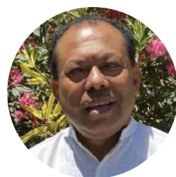
PADRE YUVENTUS KOTA SVD.